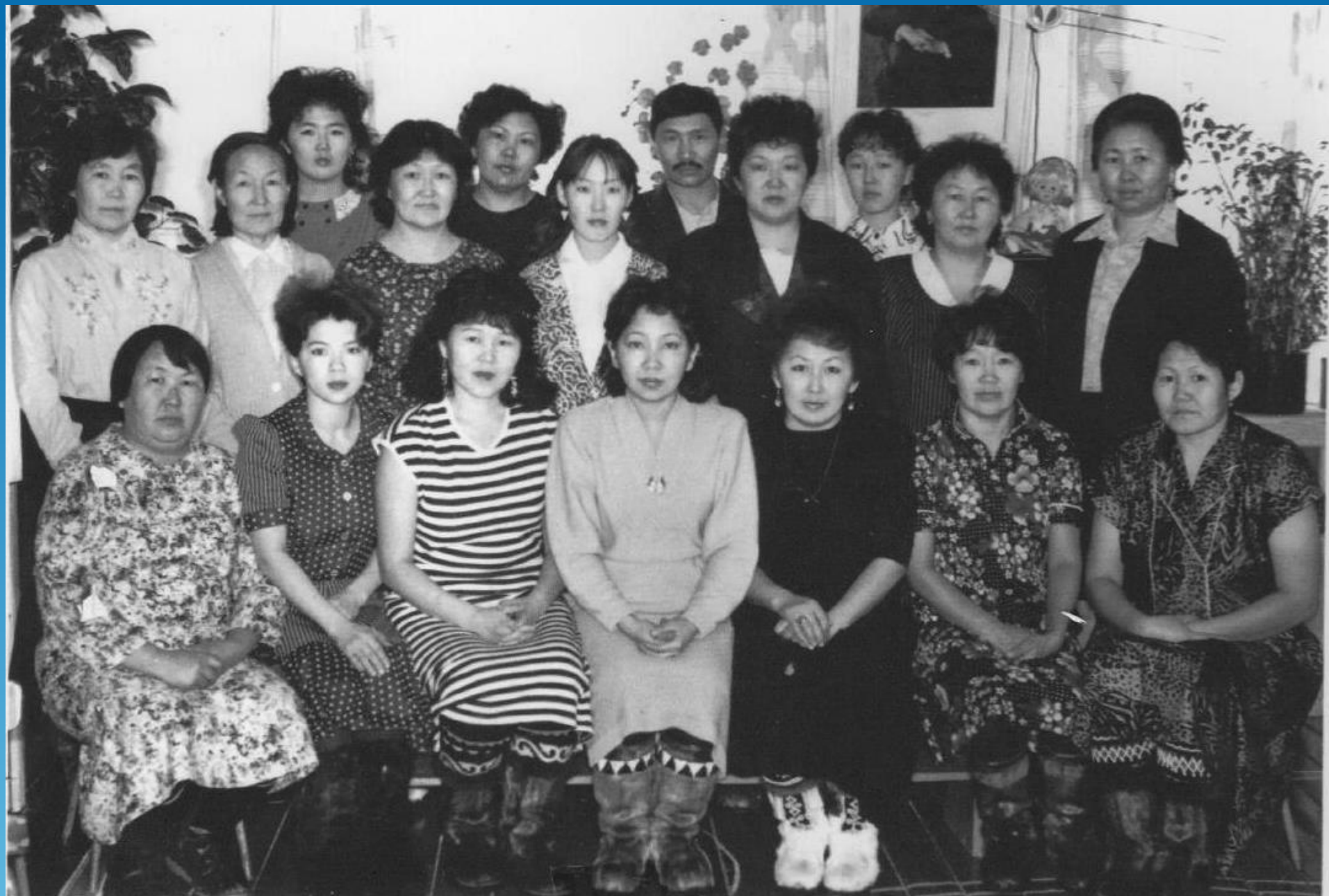
Коллектив детского сада «Хатынчан» 1992 год