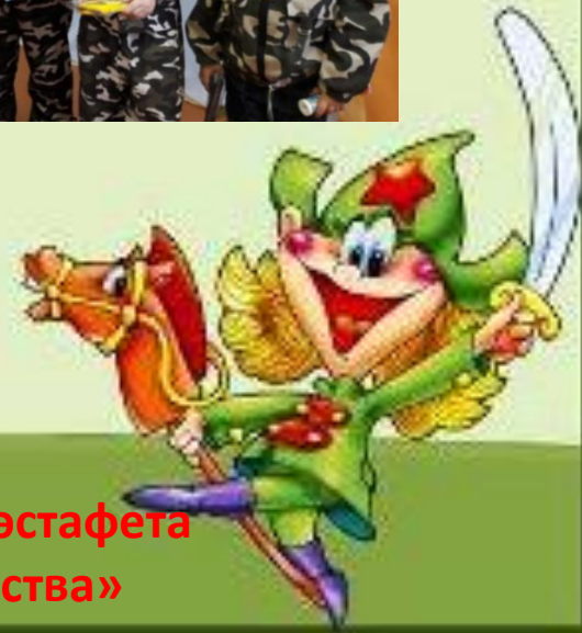
Военно-спортивная эстафета «Защитник Отечества»